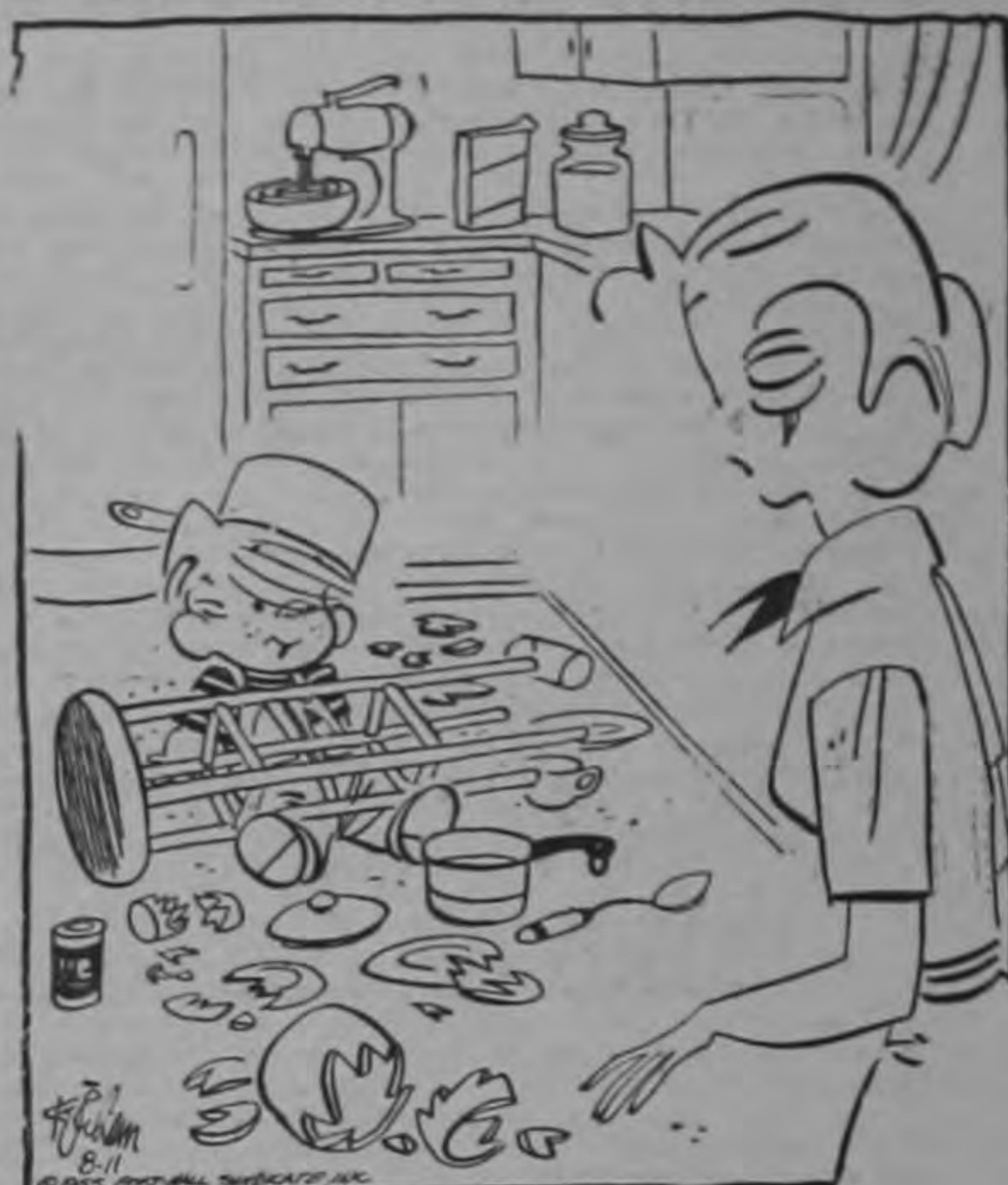
—¡Te aseguro que te vas a reír cuando te diga cómo me ocurrió esto!