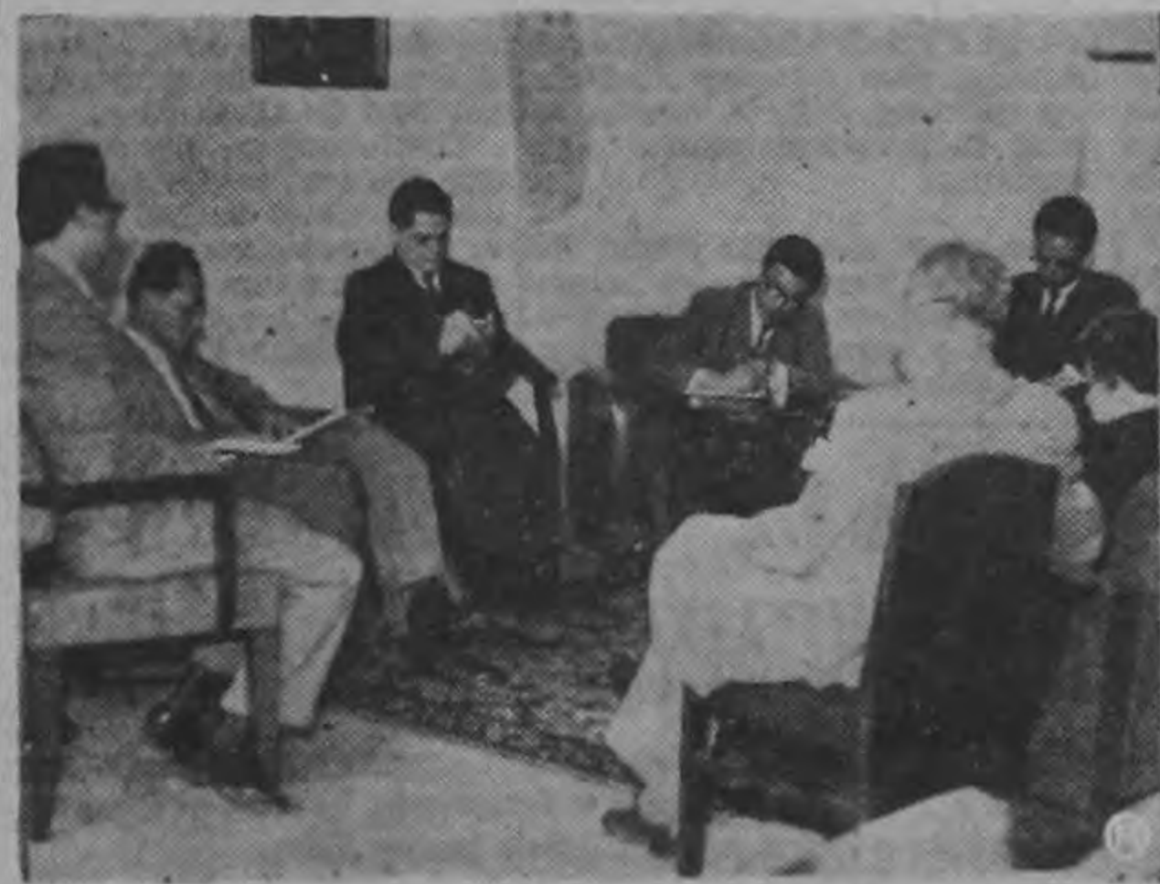
CONFERENCIA DE PRENSA — El Ministro Fallas aparece rodeado de periodistas, durante la Conferencia de Prensa de ayer, en que este funcionario expuso su parecer en relación a la fijación de salarios, formulada recientemente por el Consejo Nacional de Salarios.

En cuanto a los salarios de los artículos básicos de consumo popular se han dejado intactos, para no perjudicar el costo de los mismos y no pueda argüirse un aumento en los mismos, alegándose que así lo exige el costo de los jornales.