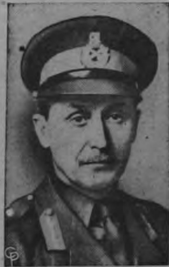
El teniente General Sir Hugh Stockwell, de 53 años de edad, es comandante británico en Alemania ha sido llevado a Londres "para consultas". Se dice que el General Stockwell será nombrado jefe de las fuerzas británicas en el Mediterráneo.