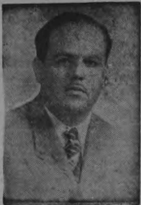
DON MARIO ESQUIVEL Ex Ministro de Relaciones Exteriores

Mucho agradecemos el envío de la presente y lujosa invitación: