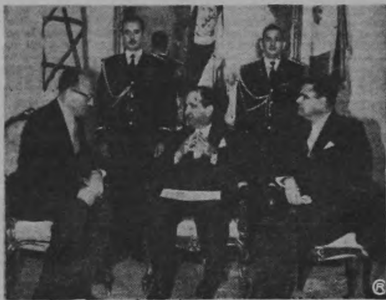
PRESENTACION DE CREDENCIALES — La Foto Solano capta el instante en que el Embajador de Israel en Costa Rica, presenta sus credenciales ante el Presidente Figueres y el Ministro de Relaciones Exteriores, Lic. Vollo Sancho, ayer en la Cancillería.

que a su vez la institución ofrece para el buen éxito del trabajo la colaboración que le sea posible.