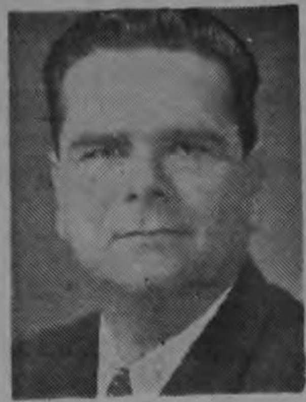
Lic. don FERNANDO VOLIO Ministro de Gobernación y Encargado del Ministerio de Relaciones Exteriores