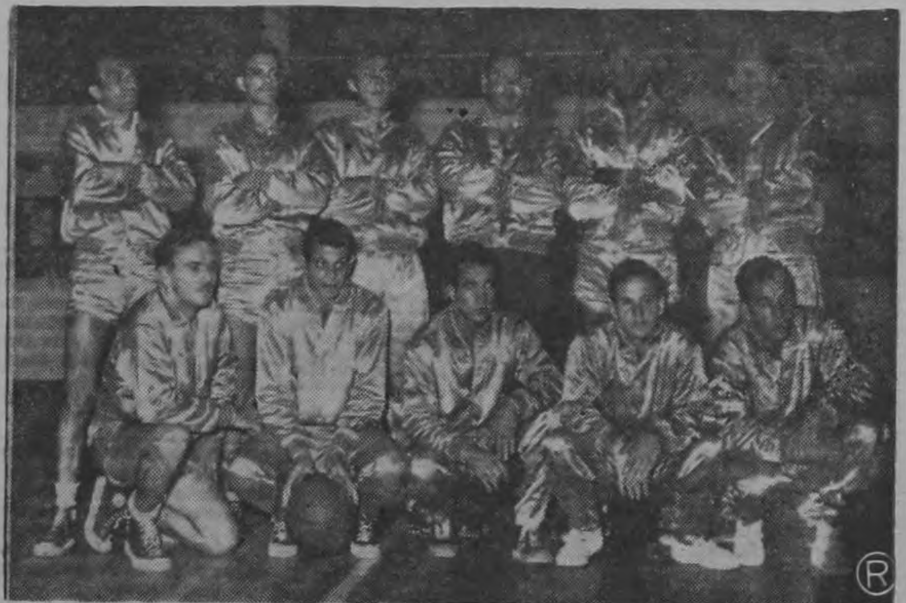
Antenoche se jugó en el Gimnasio del Colegio San Luis Gonzaga de Cartago el finalísimo de la eliminatoria por el Trofeo "Café El Unico" en la que tomaron parte todos los equipos mayores. Correspondió enfrentarse a los invictos quintetos del Seminario y de la Universidad, que en brillante labor habían ganado todos sus partidos anteriores. El triunfo y el trofeo correspondieron a los seminaristas que lograron imponerse por 54 puntos contra 49 para agregar un laurel más a los muchos que han acumulado en los últimos tiempos. No cabe duda que se trata de un equipo poderoso.